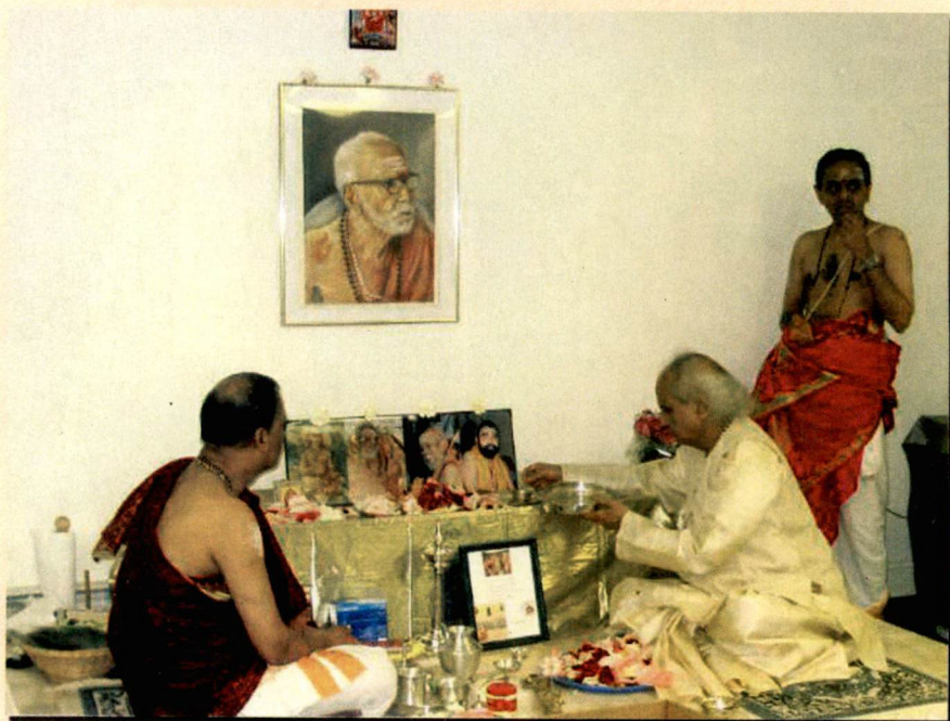
Pandit Jasraj doing Swarna Vilva Archana at Sanatana Dharma Yagna Mandali during H.H. PujyaSri Perivaa's Peetarohana Swarna Jayanthi on November 9, 2003 at NEW JERSEY U.S.A.